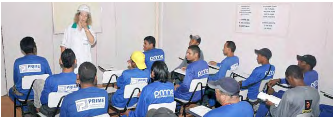
Colaboradores da MRV assistem a aula teórica em canteiro, onde têm curso e palestras educativas

a Unidade Integrada Sesi Senai Aparecida de Goiânia desenvolve ainda inúmeras outras ações em parceria com a MRV, como palestras educativas na área de saúde e segurança do trabalho. A unidade também iniciou em dezembro o programa de Educação de Jovens e Adultos (EJA) para 60 colaboradores da construtora, com duas turmas de alfabetização e uma do ensino fundamental.