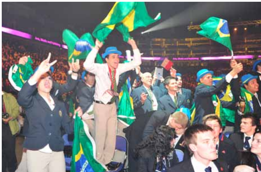
Delegação brasileira comemora a 2ª colocação no WorldSkills, em Londres

Enquanto o Senai Goiás se prepara para sediar, em março de 2012, em Goiânia, a etapa regional da Olimpíada do Conhecimento, em Londres alunos da instituição de vários Estados ganharam 11 medalhas e 10 certificados de excelência na 41ª edição do WorldSkills – maior torneio de educação profissional e tecnológica do mundo –, realizado de 5 a 8 de outubro. Com o desempenho, o Brasil alcançou a segunda colocação na competição, atrás apenas da Coreia do Sul e à frente do Japão, da Suíça, de Cingapura e de outros países de tecnologia mais avançada.