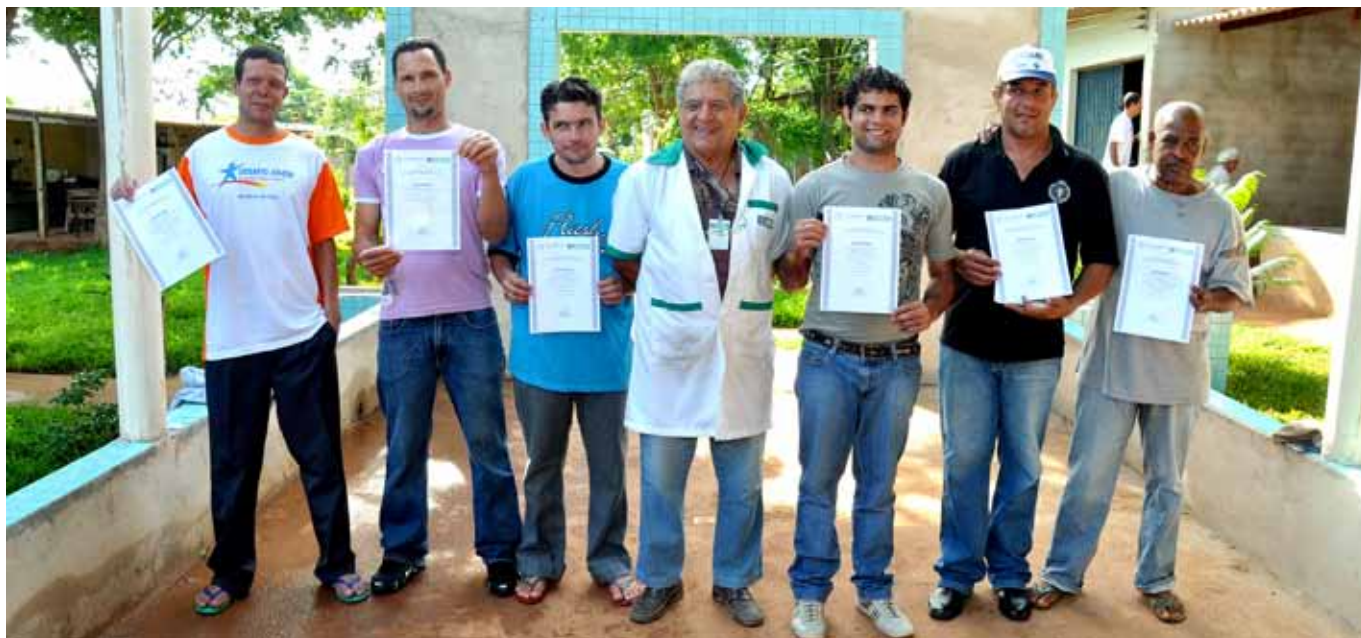
Concluintes do curso de pedreiro básico ministrado pelo Senai na Restauração Shalom exibem certificados

E m uma das muitas ações de qualificação profissional destinadas ao segmento da construção, a Escola Senai Vila Canaã realizou, no dia 11 de novembro, a entrega de certificados de conclusão para turma do curso de pedreiro básico, ministrado para 12 pessoas assistidas pela Desafio Jovem Restauração Shalom, instituição que atua na recuperação de dependentes químicos.