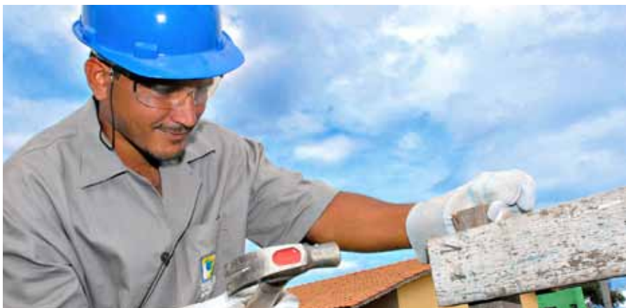
Pesquisa traça perfil da mão de obra que movimentava canteiros de obras da construção civil

Um dos setores produtivos com grande demanda por profissionais, a construção civil tem agora uma completa radiografia sobre a mão de obra que movimentava seus canteiros, instrumento importante para subsidiar o planejamento de ação para capacitação e absorção de pessoal.