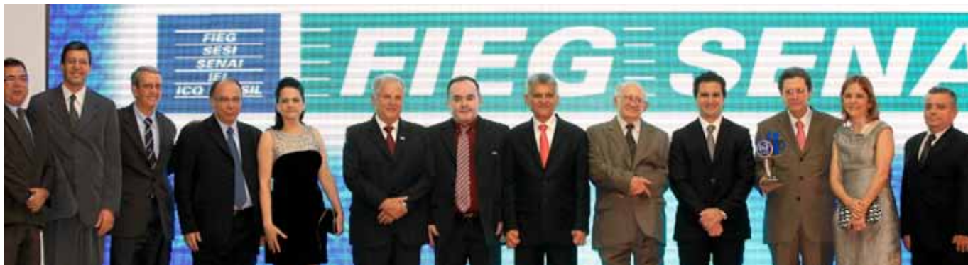
Gerentes do Senai e Sesi e diretores da Organização Jaime Câmara durante entrega do troféu Pop List

No ano em que potencializou os esforços para atender à forte demanda do mercado, com a implantação de mais uma unidade em Aparecida de Goiânia e a criação de novos cursos, o Senai Goiás comemora, pela quarta vez consecutiva, a conquista do troféu Pop List no segmento Curso Profissionalizante.