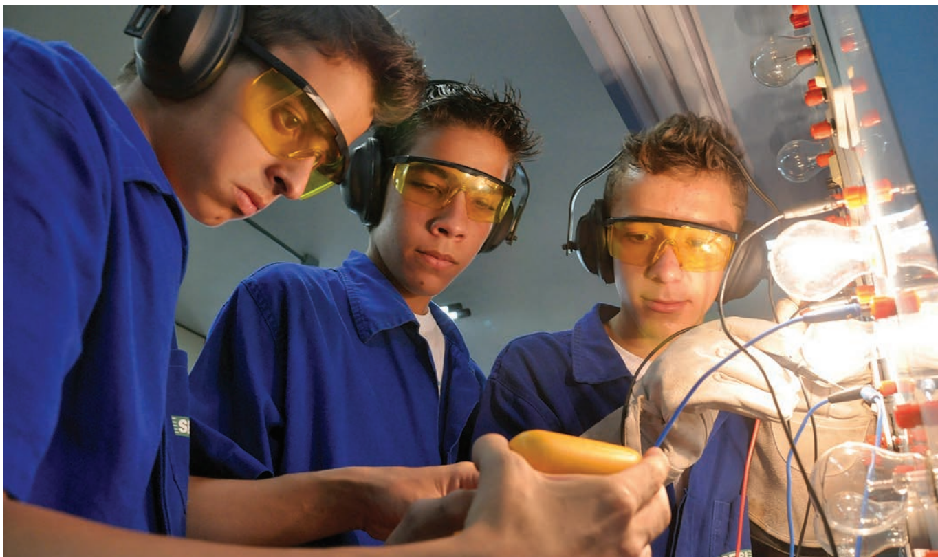
Alunos de aprendizagem na área de eletricidade: cursos no âmbito do Pronatec, oferecidos gratuitamente, ampliam ações de educação profissional para atender à demanda

Com expectativa de chegar ao fim do ano com até 20 mil matrículas no âmbito do Programa Nacional de Acesso ao Ensino Técnico e Emprego (Pronatec), do governo federal, estão em andamento nas unidades do Senai em Goiás ações de educação profissional em diversas áreas, oferecidas gratuitamente. No momento, há 50 turmas envolvendo mais de 2 mil matrículas. As atividades são realizadas paralelamente à programação normal da instituição em toda sua rede de en-